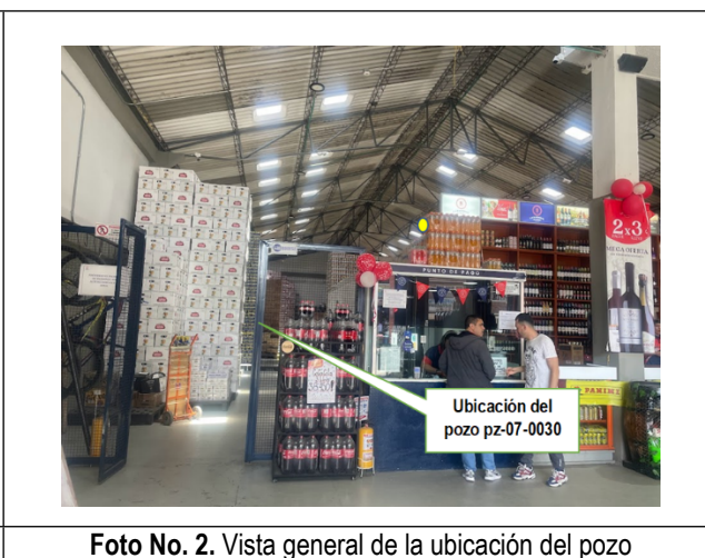
Foto No. 2. Vista general de la ubicación del pozo