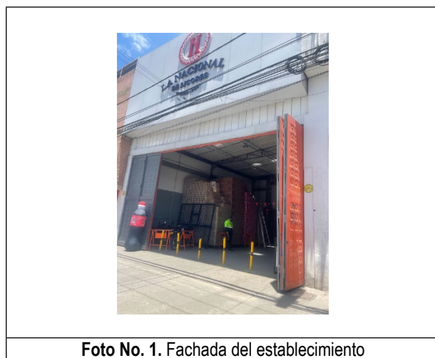
Foto No. 1. Fachada del establecimiento

El día 27 de septiembre del 2022 se realizó visita de control al predio ubicado en la Calle 65 Sur No. 78 D - 10, con el fin de verificar las condiciones actuales del pozo identificado ante la Entidad con código pz-07-0030; encontrando que la captación se localiza al costado suroccidente del predio, en el área de almacenamiento de la bodega. (Ver Foto No. 1 y 2).