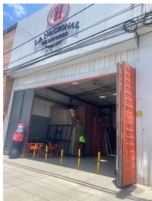
Foto No. 1. Fachada del establecimiento

El día 27 de septiembre del 2022 se realizó visita de control al predio ubicado en la Calle 65 Sur No. 78 D - 10, con el fin de verificar las condiciones actuales del pozo identificado ante la Entidad con código pz-07-0030; encontrando que la captación se localiza al costado suroccidente del predio, en el área de almacenamiento de la bodega. (Ver Foto No. 1 y 2).