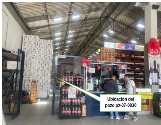
Foto No. 2. Vista general de la ubicación del pozo

Durante la visita técnica se realizó recorrido dentro de las instalaciones, donde no se observan estructuras mecánicas ni hidráulicas que se asocien con un punto de extracción de aguas subterráneas, esto a razón de que el predio fue modificado en su totalidad, para construir una bodega de almacenamiento.